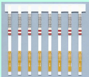
Remover os QuickStix Combs