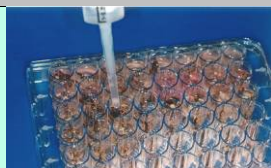
Adicionar tampão de extração