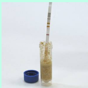
Colocar a tira dentro do tubo de extração