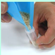
Transferir os grãos triturados para o tubo de extração