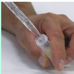
Adicionar o tampão de extração, tampar e agitar