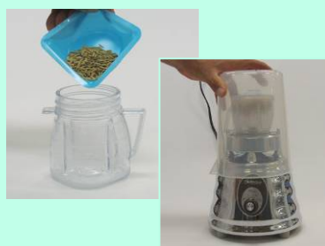
Pesar e triturar os grãos

* Disponíveis como acessórios – ver lista na página 3.