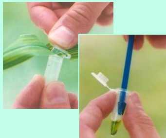
Coletar e macerar o disco foliar