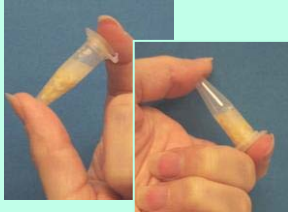
Extrair amostra da semente—a agitar vigorosa é importante