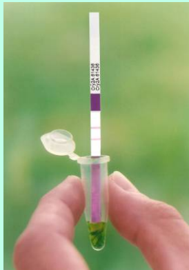
Adicionar uma tira dentro do tubo de coleta e aguardar 5 minutos