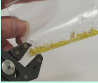
Macerar a semente individual