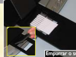
Empurrar o suporte, clicar “Ler Teste”